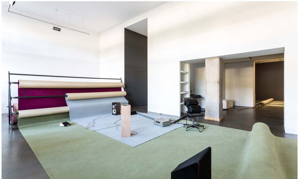
Anne Le Troter, Les mitoyennes, 2015. Pièce sonore 13 min, en collaboration avec Max Bruckert. Production La BF15, avec le soutien de Pro Helvetia, Fondation suisse pour la culture.