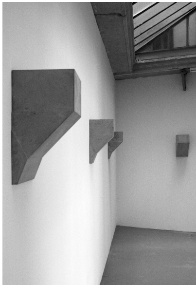
Jennifer Caubet, Entresol , 2013. 7 modules, ciment, armature métal. 41x25x21 cm.

[...] Marie Bechetoille : Tu sembles percevoir l'espace d'exposition comme un territoire à conquérir, à l'image du titre d'une de tes pièces : Stratégie d'occupation des sols (2009) ?