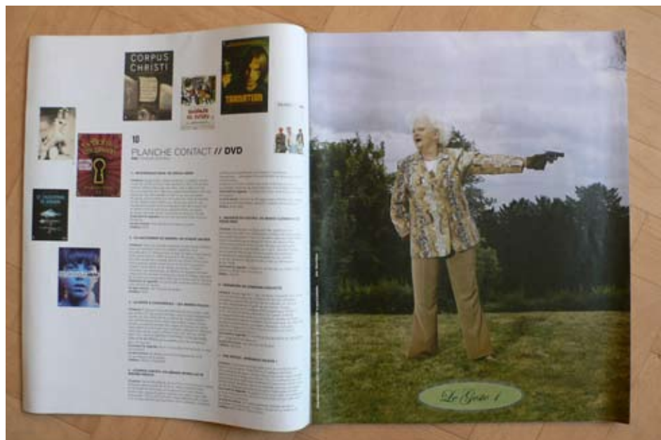
© Edouard Boyer invente Le GESTE 1 , 2005, parution dans De l'air